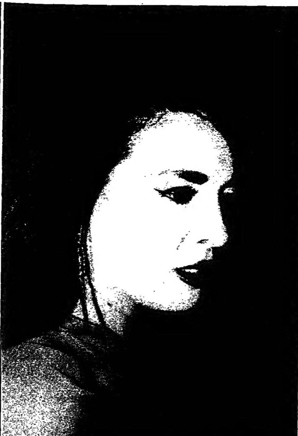
الفنانة المصرية جلاء فتحي... عن رواية الابيب بهاء طاهر...